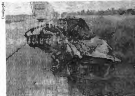
Monte de ferro retorcido foi o que sobrou do carro de passeio

No carro estavam cinco pessoas da mesma família, sendo duas mulheres e dois homens, que morreram no local. Outra mulher foi encaminhada para um hospital em Vitória do Mearim e não corre risco de morrer, segundo a Polícia Militar. Os nomes das vítimas não foram infor-