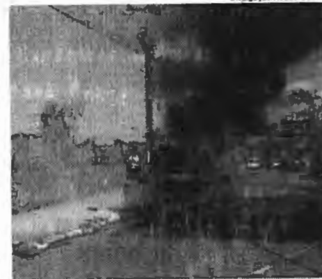
Veículo teve perda total ao ser consumido pelo fogo nesta segunda-feira

Muitas pessoas reclamam que acionar o Corpo de Bombeiros em Imperatriz, está sendo difícil, já que o 193 às vezes não está atendendo. Nesse caso é mais prudente que acionem os números (99) 9211-5950 e (99) 9191-6782.