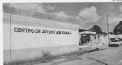
Servidores de unidades da Funac reclamam de atraso do governo