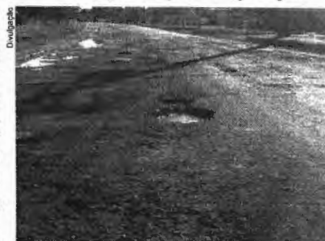
Decisão responsabiliza a administração pública pela existência de buracos e colocar a população em risco de vida, danos físicos e prejuízos materiais

Respondendo pela Vara da Fazenda e Registros Públicos de Palmas, o magistrado ressaltou que os valores, tanto do ressarcimento frente aos prejuízos com a motocicleta, quanto os relacionados ao dano moral terão que ser corrigidos monetariamente e