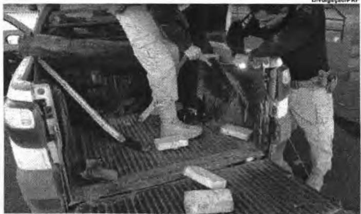
Itumbiara (GO) - A PRF base de cocaína escondidos em um veículo na BR 153, em Itumbiara, região sul do estado, na manhã desta segunda-feira (15).

O veículo, uma picape Strada, recebeu ordem de parada de uma equipe que estava em ronda pela rodovia na altura do km 703, próximo à unidade operacional da PRF. O condutor, entretanto, fugiu para o matagal, abandonando o veículo na rodovia. Ao realizarem buscas na picape, os policiais localizaram 30 quilos de pasta base de cocaína escondidos em tabletes distribuídos na lataria da caçamba. A droga será encaminhada para a polícia civil de Itumbiara e as equipes policiais continuarão empenhadas nas buscas pelo condutor foragido. (Assessoria PRF)