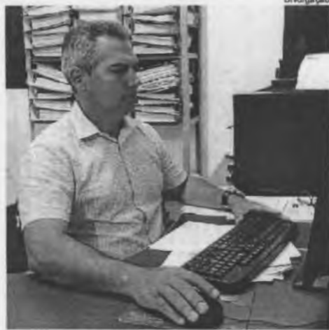
Prof. Edilomar Miranda

A implantação do novo sinal foi apenas uma etapa do trabalho de expansão do sinal da TV Brasil pelo país.