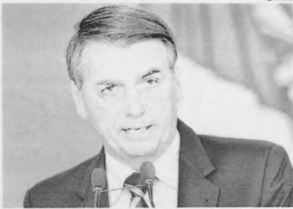
Presidente Bolsonaro determinou medidas para combater fraudes em benefícios pagos pela Previdência Social

Conforme o Ministério da Cidadania, até 31 de dezembro de 2018, foram realizadas 1.183.089 prestações com 574,5 mil benefícios