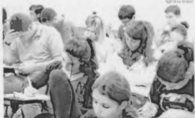
O Enem foi aplicado nos dias 4 e 11 de novembro do ano passado

cancelados. O processo de revisão gerou uma economia de R$ 4,2 bilhões somente no auxílio-doença.