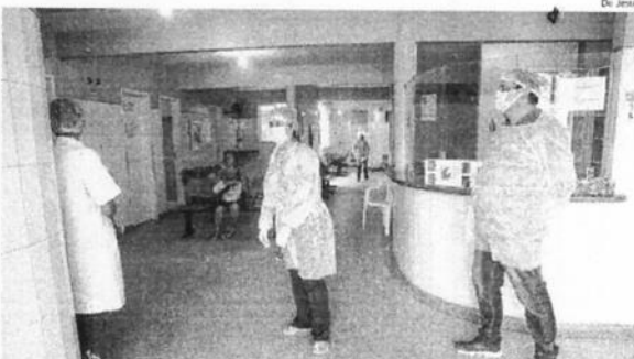
Profissionais de Saúde atuam com uso de Equipamentos de Proteção Individual em postos e hospitais

Apesar de ainda não ter orientações para trabalhar especificamente com aqueles que estão infectados, os outros hospitais que a funcionária trabalhará já a orientaram sobre algumas precauções, como sempre lavar as mãos, usar máscara de cirúrgica e evitar tocar em objetos sem