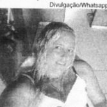
Mulher que foi encontrada morta no carro na Avenida Newton Bello

removido para o Instituto Médico Legal (IML), onde ainda ontem, após a necropsia, foi liberado para familiares.