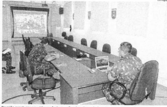
Reunião aconteceu em videoconferência, a fim de evitar o deslocamento e aglomeração dos participantes

Segundo a Comunicação Social, a ajuda do Exército dependerá da solicitação do Governo do Estado e das prefeituras. Nesta quarta-feira, 25, terá início a ajuda, na capital ma-