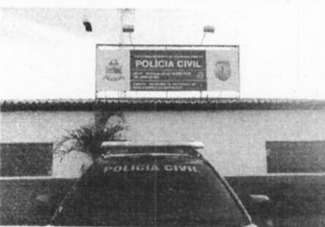
Prédio onde funcionará temporariamente as especializadas DHPP e DENARC/Itz

As Delegacias de Homicídio e Proteção a Pessoa (DHPP) e Delegacia de Repressão ao Narcotráfico (Denarc/Itz) passarão a atender no prédio antigo do 3º Batalhão de Bombeiros Militares (3º BBM), localizado na Rua Leônicio Pires Dourado, bairro São José do Egito, em Im-