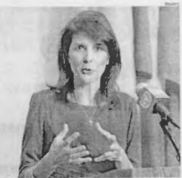
Nikki Haley, embaixadora dos EUA, se posicionou contra a proibição