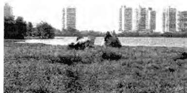
Partes da serpente que deveriam estar na água, mas estão no mato

Mesmo sob as recomendações de especialistas de perigos no consumo dos peixes oriundos da lagoa, por falta de alternativas e com a alegação de baixa condição de renda, os pescadores sobrevivem e se alimentam dos peixes da lagoa. Histórias de vida não faltam.