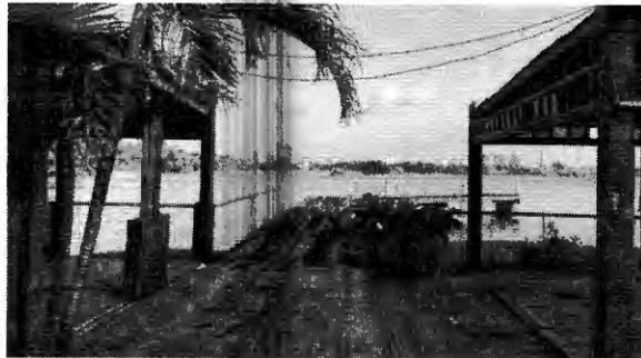
Espaços que antes abrigavam bares e restaurantes e recebiam visitantes, hoje estão sucatados e esquecidos

A formação hidrográfica também propiciou, ao longo das décadas, que comunidades ribeirinhas na Lagoa sobrevivessem da pesca. Até hoje, alguns pescadores dependem do alimento encontrado na Lagoa. Parte da produção é usada para subsistência (ainda que com restrições,