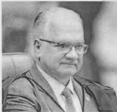
Ministro diz entender que caso deve ser decidido somente em plenário

A decisão do ministro Edson Fachin, do Supremo Tribunal Federal (STF), de submeter ao plenário da Corte a análise do mérito do habeas corpus impetrado pela defesa do ex-presidente Luiz Inácio Lula da Silva (PT) terá os 11 ministros do STF rediscutem a possibilidade de execução provisória de pena — como a prisão — após condenação em segunda instância.