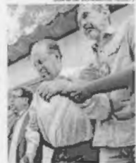
Defesa pede que seja suspensa a decisão para executar pena

O ministro Dias Toffoli, do Supremo Tribunal Federal (STF), solicitou informações ao ministro Edson Fachin sobre o pedido de habeas corpus do deputado federal Paulo Maluf (PP-SP), feito à Corte no dia 1º de fevereiro. O parlamentar está preso no Complexo Penitenciário da Papuda desde o dia 22 de dezembro, por determinação de Fachin.