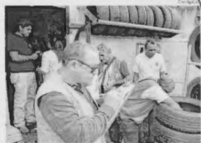
Agentes da Prefeitura vistoriam barbearia no bairro Vinhas

entre os dias 7 e 18 de maio, todos os participantes do Exame Nacional do Ensino Médio 2018 devem se inscrever no site do Enem entre os dias 7 e 18 de maio. ●