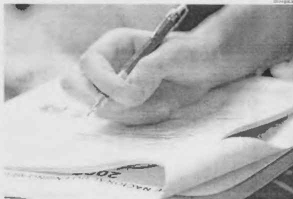
As provas do Enem deste ano serão aplicadas nos dias 8 e 11 de novembro, de acordo com o Inep

Quem pode pedir isenção Nesta edição, o valor a ser pago para fazer a prova é de R$ 82.