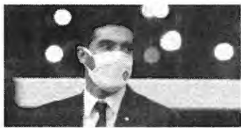
Abel Ferreira vai ser condecorado pelo presidente português por conquistas no Brasil

Primeiro técnico europeu da história do Palmeiras, Abel Ferreira chegou ao Brasil em novembro de 2020 e, em pouco mais de quatro meses de trabalho, faturou duas taças. O comandante será condecorado pelo presidente de Portugal, Marcelo Rebelo de Sousa, nesta segunda-feira (22), com a Ordem do Infante D. Henrique, honraria para aqueles que tenham prestado serviços que valorizem a história de Portugal. A informação foi publicada inicial-