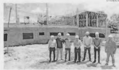
Vistoria no canteiro de construção do Centro de Educação Profissional

A remuneração total em rubrica pelas usinas, de julho de 2018 a junho de 2019, será de R$ 1,584 bilhões, segundo a Aneel. No primeiro semestre, a tarifa média das concessionárias em R$ 662,7 MWh inclui por megawatt hora, com tributos. Para o segundo semestre, a tarifa será de R$ 101,187 MWh, com tributos. Do ciclo 2017/2018 para o 2018/2019, o aumento de usinas em regime de cotas mantém-se em 69. ■