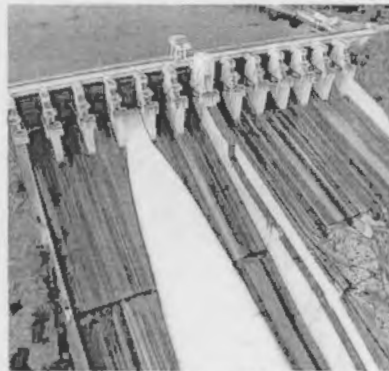
Grande parte desse reajuste vai ressarcir 33 das 69 hidrelétricas

Para ter direito a essa renovação, porém, as empresas precisam re-