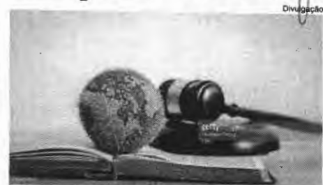
subterfúgio para a colisão de direitos fundamentais, qual seja o direito ao meio ambiente equilibrado”, concluiu o juiz. (Asscom - Corregedoria Geral da Justiça)