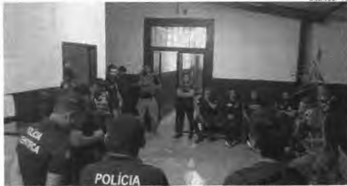
Dozenas de policiais participaram da operação

A Polícia Civil deflagrou a operação 'Laboratório', nesta segunda-feira (13/03), visando investigar a prática de lavagem de dinheiro do tráfico de drogas por meio de estabelecimentos comerciais na cidade de Paraíso do Tocantins.