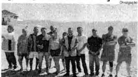
A campanha tem sido bem sucedida com a redução gradual do lixo retirado das praias

Em Garimpinho, a Prefeitura de Araguaína intensificou o trabalho de limpeza na praia e no povoado. Em agosto, será