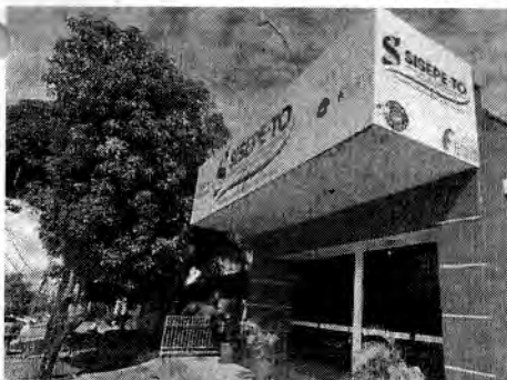
Servidores ativos e inativos devem revisar seus contratos de crédito consignado e reivindicar seus direitos

A Justiça do Tocantins determinou a redução de taxas de juros em contratos de empréstimos consignados de servidores públicos, bem como a devolução em dobro, com juros e correção monetária, dos valores cobrados indevidamente nas parcelas pagas.