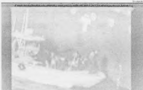
Imagem de vídeo mostraria integrantes da Guarda Revolucionária retirando uma mina do casco de navio

A tensão política e militar entre os Estados Unidos e o Irã aumentou nesta sexta-feira (14), com a divulgação pelo Pentágono de um vídeo que supostamente mostraria integrantes da Guarda Revolucionária Iraniana retirando uma mina explosiva do casco de um dos navios petrolíferos atacados na manhã de quinta-feira (13) no Golfo de Omã. A acusação veiculada pelo governo americano foi indiretamente contestada pelo presidente da empresa proprietária do navio, o Kokuka Corporation, segundo o qual a explosão foi provocada por um 'objeto voador', e não por uma mina.