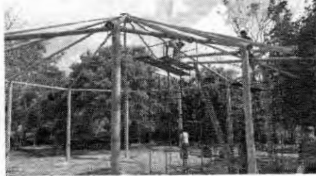
A Pousada Rancho das Estrelas, em Carolina, viu a possibilidade de investir na construção de restaurante com layout e design rústicos com assessoria especializada da área de marcenaria do SENAI

"Nossa demanda é bem alta e tínhamos somente uma cozi-