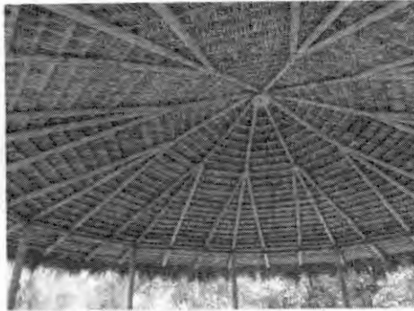
A Pousada Rancho das Estrelas, em Carolina, viu a possibilidade de investir na construção de restaurante com layout e design rústicos com assessoria especializada da área de marcenaria do SENAI

Melhorias rápidas, de baixo custo e alto impacto têm mudado o perfil de empresas maranhenses e apontado novos caminhos para investir