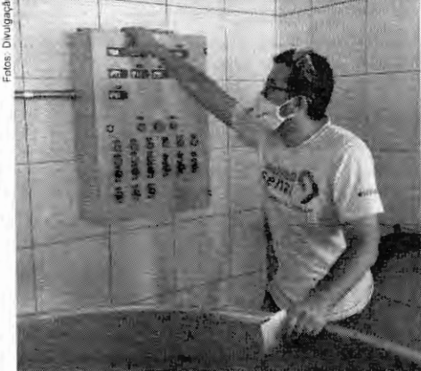
Na indústria de Cachaça Vale do Riachão, o trabalho de automatização do controle de processo das dornas fermentativas, resultou em mais qualidade, agilidade, rendimento e consequentemente mais lucro

A cachaçaria saiu do processo manual para o automático, pois antes a leitura de temperatura das dornas (tanque) era realizada com ajuda de termômetro e o processo de resfriamento manualmente. Hoje, com sensor de leitura de temperatura dentro das dornas fermentativas, ligadas a uma válvula e ao quadro de comando, tanto a leitura da temperatura como o resfriamento são realizados de forma automáticas.