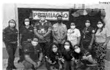
Equipe do Sesi-MA com alunos vencedores do torneio de robótica