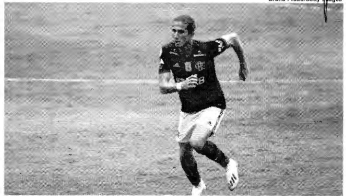
Filipe Luís tem menos de seis meses de contrato pela frente com o Flamengo