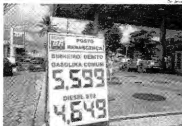
Preço da gasolina em postos do Maranhão tem variação positiva

No Brasil, o preço médio da gasolina registrou variação positiva pelo 13º mês seguido. Em média, o litro foi vendido a R$ 5,915 (no mês anterior,