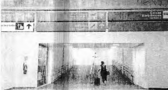
Passageira dirige-se ao embarque no Aeroporto Marechal Cunha Machado, minoria no Maranhão

No Maranhão, não dormiram em algum morador viajou com finalidade pessoal, em 33% deles e