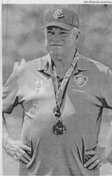
Site oficial do Corinthians

"Nós vamos precisar dar a vida em campo, arriscar durante o jogo. De outro lado do campo vai ter um adversário muito qualificado, que ganhou o primeiro jogo e que tem vantagem do empate. Por isso mesmo não adianta imos com sede de pote, pois eles marcam muito bem