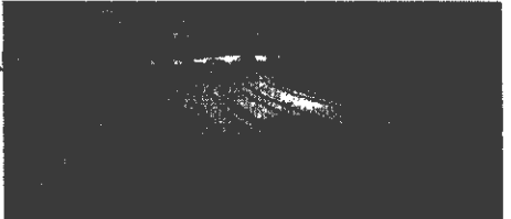
Custo do frete poderá ser reduzido em até 40%

Sem alarde, o Brasil acaba de concluir um das maiores — e mais polêmicas — obras de logística. Depois de 36 anos, a Ferrovia Norte-Sul está pronta. No fim de maio, foi concluído o último trecho da "nova-velha" estrada de ferro, entre Palmeiras de Goiás e Guanaruã, no interior de Goiás. O traçado original previa 4,1 mil quilômetros de trilhos, literalmente, cortando o país. Eles iam do porto de Itaquí, no Maranhão, até o porto de Rio Grande, no Rio Grande do Sul — daí o nome da ferrovia. Depois de erros técnicos, inúmeros escândalos e cerca de R$ 1,5 bilhões investidos, esse percurso encolheu. A Norte-Sul ficou com 2,2 mil quilômetros. Agora, o correto seria chamá-la de Norte-Sudeste.