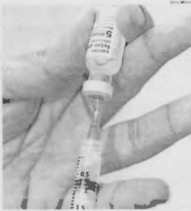
Dose e recomendação a quem visita o Maranhão e mais 19 estados e DF

Além de acordar com a OMS, em testes realizados em humanos observados a longo prazo, dos últimos grandes picos sazonais, no primeiro trimestre de 2016 e 2017, o segundo