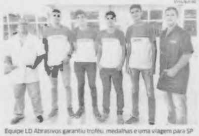
Equipe LD Abrasivos garantiu troféu, medalhas e uma viagem para SP

Uma dose é indicada a quem visita o Acre, Amapá, Amazonas, Bahia, Espírito Santo, Goiás, Maranhão, Mato Grosso, Mato Grosso do Sul, Minas Gerais, Pará, Paraná, Paraíba, Rio de Janeiro, Rio Grande do Sul, Rondônia, Roraima, Tocantins, Santa Catarina e São Paulo. Além do Instituto Federal