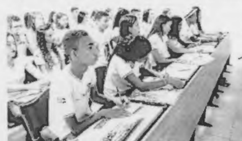
Visita à Assembleia Legislativa

Estudantes do Instituto Federal do Maranhão (IFMA) Campus Buriticupu realizaram, na manhã desta quinta-feira (24), uma visita às instalações da Assembleia Legislativa. Eles tiveram a chance de conhecer a estrutura da Casa e participaram de palestras proferidas por consultores legislativos, que explicaram como funciona o Parlamento maranhense.