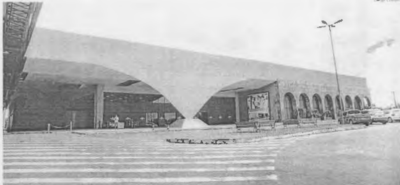
Fachada do Multicenter Sebrae, onde acontecerá mais uma edição da Ação Global, que oferecerá mais de 200 serviços para o público

Evento promovido pelo Sesi e Rede Globo (TV Mirante) acontecerá neste sábado, 26, das 8h às 17h, no Multicenter Sebrae, em área de 11 mil metros quadrados