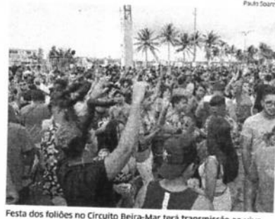
Festa dos foliões no Circuito Beira-Mar terá transmissão ao vivo

Durante o evento, as dúvidas das pessoas foram provocadas, com um objetivo positivo. O posicionamento crítico de cada profissional, em sua especialidade, contribuiu para a relevância do bate-papo. ■