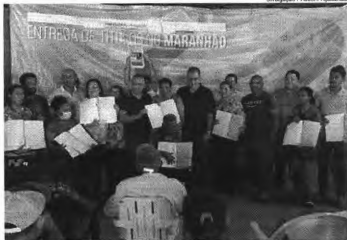
Entrega de títulos de terra para assentados da região do P.A. Açaí chega à segunda etapa

Aconteceu no Assentamento Sudelândia (50 BIS), a entrega de titulação para beneficiários do Programa Nacional de Reforma Agrária (PNRA) da região PA Açaí. Já é a segunda etapa de entrega de títulos realizada em 2022, pelo INCRA - Instituto Nacional de Colonização e Reforma Agrária. O evento foi realizado no dia 30.