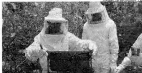
Dados de 2017 registra um total de aproximadamente 1.300 apicultores distribuídos e 53 associações

A produção de mel no Tocantins é uma atividade em potencial de crescimento, principalmente para geração de renda na agricultura familiar. Neste sentido, o Governo do Estado, por meio da Secretaria da Agricultura, Pecuária e Aquicultura (Seagro) Federação Tocantinense de Apicultura (Fetopap), Instituto de Desenvolvimento Rural do Tocantins (Ruralins) e parceiros realizam em 2022, o Censo para mapeamento da cadeia produtiva da apicultura e meliponicultura tocantinense.