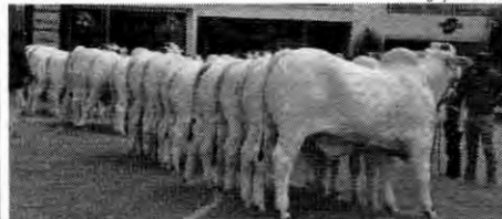
Expoinel Minas 2022 será realizada de 10 a 20 de fevereiro, em Uberaba (MG)

A Associação Mineira dos Criadores de Nelore (AMCN) promove, com apoio da Associação dos Criadores de Nelore do Brasil (ACNB), a Expoinel Minas 2022, no Parque de Exposições Fernando Costa, em Uberaba (MG), de 10 a 20 de fevereiro. A entidade tem expectativa de receber 400 animais na mostra.