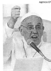
Papa Francisco durante evento

No entanto, sacerdotes de rito oriental podem contrair matrimônio e manter suas funções.