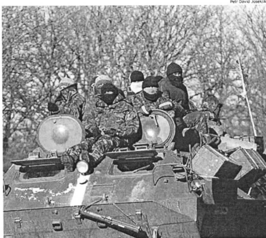
Soldados ucranianos em tanque em rodovia a caminho de Debaltsevo, no leste da Ucrânia, terça-feira

O porta-voz Andriy Lysenko falou durante um briefing regu-