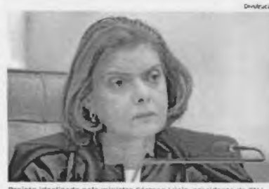
Projeto idealizado pela ministra Cármen Lúcia, presidente do CNJ