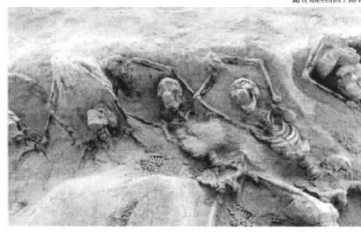
Corpos encontrados por arqueólogos foram enterrados acorrentados