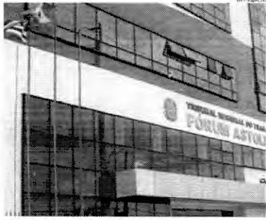
TRT-MA: para Dias Toffoli, falta estrutura para julgar volume de ações

O ministro Dias Toffoli ressaltou que a Justiça do Trabalho está 100% digitalizada no Brasil. "Isso é muito im-