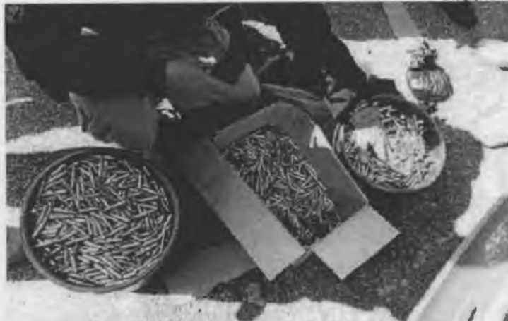
Munições de fuzil seriam entregues em comunidades

Um carregamento contendo mais de 7,3 mil munições de fuzil foi apreendido na tarde de ontem (20) pela Polícia Rodoviária Federal (PRF) em abordagem a um veículo de passeio que trafegava pela Rodovia Presidente Dutra (BR-116), em Seropédica, região metropolitana do Rio de Janeiro. Dois homens foram presos em flagrante e autuados por tráfico internacional de munições para armas pesadas.