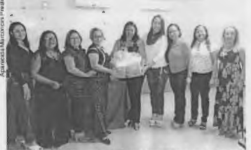
Entrega do Kit para o CE Dorgival Pinheiro de Sousa