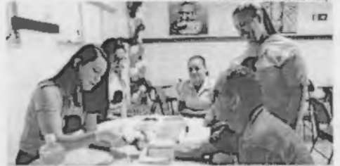
Ação também será realizada sábado, 24, no A Gente Faz Cidadania, no povoado Coqueirão