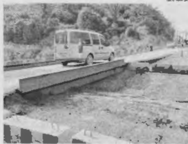
Condutores burlam restrição e trafegam sobre trecho comprometido

tráfego. Mesmo sob restrição, a tarde de ontem (16), milhares de veículos usaram a estrutura imediatamente para deslocar passageiros até a Vila Maranhão e suas áreas.