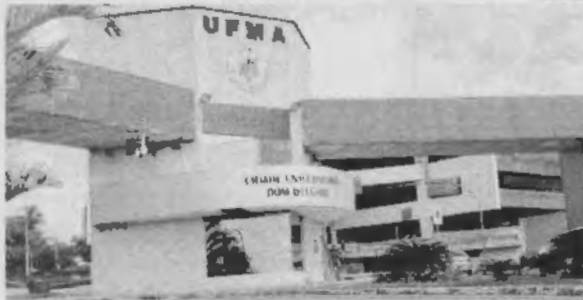
Caso o plano de contingência de verbas federais não seja revogado, UFMA não terá condições de se manter

O risco de interrupção das atividades da Universidade Federal do Maranhão (UFMA) é iminente, devido ao contingenciamento de aproximadamente R$ 27 milhões no orçamento da instituição de ensino superior (IES), conforme determinação do governo federal, por meio do Ministério da Educação (MEC). O bloqueio anunciado em 30 de abril, representa uma das gestões discricionárias — destinadas à manutenção da universidade — realização de obras e compra de equipamentos — e a 5% do orçamento anual total da UFMA e caso não seja reconsiderado, inviabiliza a continuidade do calendário letivo da instituição. Esclarecimento foi feito na manhã de ontem (16), pela reitoria da IES, Nat Pereira, em entrevista à imprensa.