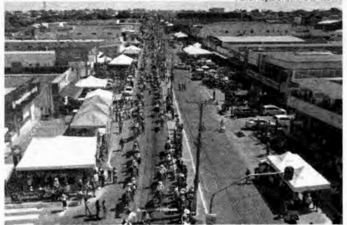
Comitivas concorreram a uma moto no valor de R$ 28 mil e dois animais

"É muito importante ver a diversão das pessoas, o lado cultural, pois a Cavalgada faz parte da essência de Araguaína e ainda movimentam a economia da cidade. Esse evento proporciona oportunidades de negócio para milhares de pessoas, valorizando o empreendedorismo da cidade, que é muito forte", finalizou o prefeito Wagner Rodrigues. (Assessoria)