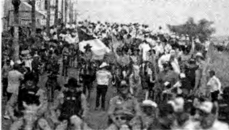
33ª edição da cavalgada de Araguaína, a maior do mundo