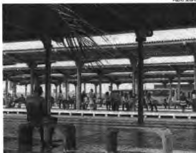
Segundo o Google, houve menos movimentação em terminais

D e 21 de fevereiro e 4 de abril de 2021, os ludovicenses frequentaram 35% menos os terminais de transporte público, como estações de ônibus e trem. É o que aponta os dados de mobilidade do Google, no comparativo com o valor-base - que é a média do dia da semana correspondente, durante o período de cinco semanas, entre 3 de janeiro e 6 de fevereiro de 2020. Nesta quinta-feira, 8, O Estado conversou com usuários do sistema para saber se houve diferença, ou não, e as opiniões foram diversas. A Secretaria Municipal de Trânsito e Transportes (SMTT), em nota, afirmou que a redução foi observada. A média de passageiros entre 5 de março a 4 de abril - período em que novas medidas de combate ao coronavírus foram adotadas no Maranhão, até a última atualização dos dados de mobilidade do Google - foi de 239 mil. "Durante o período, 668 ônibus circularam na capital. A SMTT ressalta que reduziu a frota em mais 30 ônibus em horário de pico e criou a linha Rápido São Luís, com oito ônibus articulados", afirmou a nota. Em janeiro, a média de passageiros ficou em 295 mil e 585 ônibus circularam na capital, no período em fevereiro, a média de passageiros foi 272 mil e foi mantido o mesmo quantitativo de coletivos.