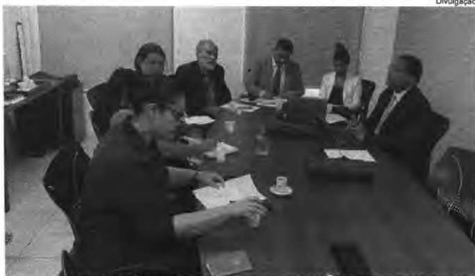
Grupo de trabalho foi criado pelo TJMA e Corregedoria para planejar e executar ações voltadas à garantia de direitos aos povos indígenas da região Arariboia