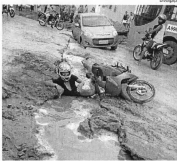
A motociclista é vista dentro da vala com a sua motocicleta, na MA-201

Situação aconteceu na manhã de sexta-feira, 15, após a motociclista ter tentado transpor obstáculo na rodovia