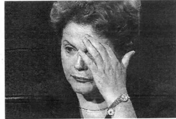
Dilma vai ter prazo para se defender no processo que tenta afastá-la

Os partidos que integram a base aliada do Governo Federal indicaram mais da metade dos deputados leais que farão parte da comissão especial. Ao todo, o bloco governista contou com 36 de 65 integrantes do