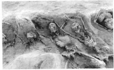
Corpos encontrados por arqueólogos foram enterrados acorrentados