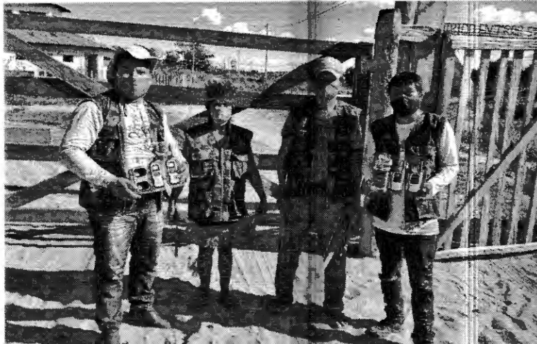
Indígenas em frente ao portão da reserva Arariboto, uma das mais populosas do Maranhão e que terá auxílio contra a Covid-19

Ação conjunta visa intensificar a assistência nas aldeias com a oferta de atendimento médico especializado, testagem e envio de insumos ao polo