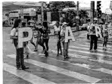
Programação iniciará com ação educativa em faixa de pedestre

De janeiro a agosto foram realizadas nove missões interministeriais com o objetivo de combate à COVID-19: evitar a disseminação da doença e levar atendimento especializado que evita a remoção de pacientes aos centros urbanos. ●