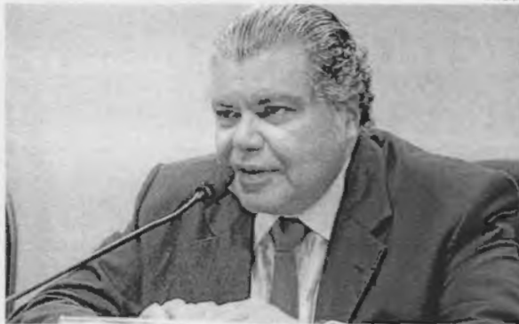
O ministro Sarney Filho anunciou ontem a realização do curso de zoneamento ambiental de Imperatriz

"O ZAM constitui-se como um instrumento fundamental na atua-