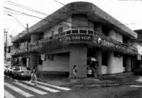
Prédio da Câmara de Araguaína no centro da cidade

Em breve, a Câmara Municipal de Araguaína terá uma nova sede, ampla e moderna. Nesta segunda-feira (8), foi anunciada a publicação do aviso de licitação objetivando a alienação/venda do prédio que atualmente abriga a Casa de Leis, no centro da cidade.