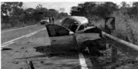
Os acidentes de trânsito são um grave problema de saúde pública

Mais de 70% dos pacientes ortopédicos sofreram acidente de trânsito