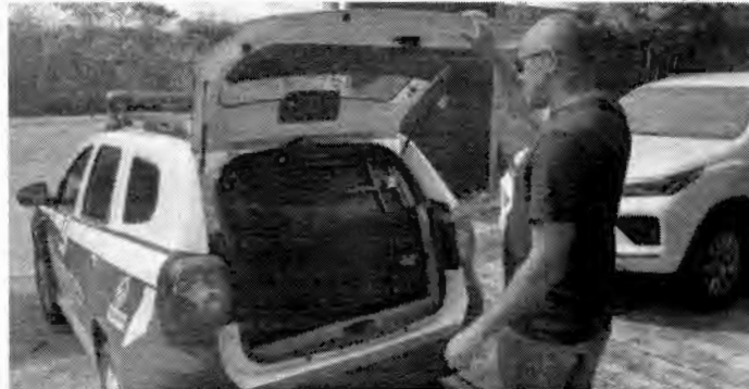
Dois pessoas foram presas pela Polícia Civil do Tocantins

Produtos apreendidos: Entre os produtos impróprios para o consumo retirados de comercialização estão: farinha de trigo, azeitona, queijo, passa roupa, empinado de frango, aveia em flocos finos, café, shampoo, hidratante infantil, sabonete, tempero completo, creme kit, marmom glacê, pomada massageadora, aguardente, esmalte, entre outros. (Assessoria)