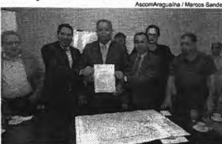
A primeira etapa da obra já está licitada no valor de R$ 25 milhões, sendo R$ 25 milhões de emenda do senador e mais R$ 7 milhões de contrapartida da Prefeitura

Contribuição decisiva Toda a canalização terá aproximadamente 2,8 km de extensão, iniciando na Avenida Filadélfia e finalizando no Lago Azul, e está orçada em cerca de R$ 96 milhões. A primeira etapa, com o custo de