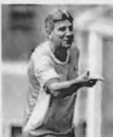
Renato Gaúcho reencontra o elenco nesta sexta-feira

Depois de ter sido submetido a uma cirurgia no coração, o técnico Renato Portaluppi orientou um trabalho coletivo da equipe do Grêmio nesta sexta-feira que será usada na estreia do Campeonato Gaúcho, no dia 20, contra o Novo Hamburgo.