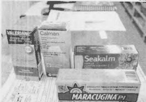
Medicamentos à base de vegetais aliviam a ansiedade e são os mais procurados durante a pandemia

A pandemia da Covid-19 está causando muito mais do que problemas fisiológicos, que se manifestam a partir dos sintomas, como febre, dor de cabeça e tosse seca. Com o aumento de distanciamento social, muitas pessoas estão sofrendo, também, complicações emocionais, que estão diretamente relacionadas às reações do sistema Nervoso Simpático. Devido a essa realidade, que afeta as variáveis diárias, a demanda por medicamentos fitoterápicos para ansiedade aumentou na região metropolitana de São Luís.