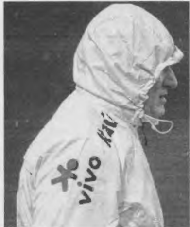
Tite comandou treino do time nacional, nesta segunda, na chuva

O coordenador técnico da Seleção Brasileira, Edu Gaspar, revelou que uma assessoria jurídica da CBF está instalada na Granja Comary para dar o suporte a Neymar