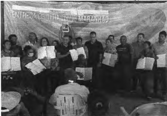
Entrega de títulos de terra para assentados da região do P.A. Açaí chega à segunda etapa

Aconteceu no Assentamento Sudclândia (50 BIS), a entrega de titulação para beneficiários do Programa Nacional de Reforma Agrária (PNRA) da região PA Açaí. Já é a segunda etapa de entrega de títulos realizada em 2022, pelo INCRA - Instituto Nacional de Colonização e Reforma Agrária. O evento foi realizado no dia 30. A titulação vai garantir aos