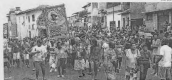
Grande número de pessoas invade a Madre Deus para o início das festas de pré-Carnaval no bairro

Situação diferente do que acontece com o comércio