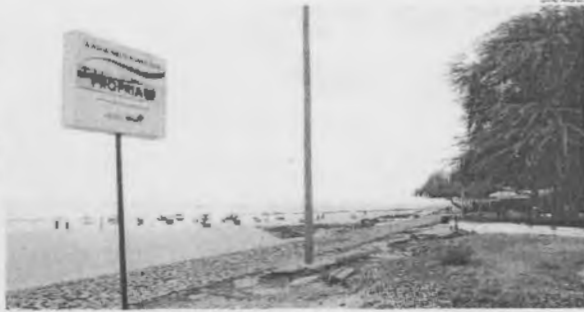
Trecho de praia impróprio continuava com placa de próprio, na manhã de sexta-feira, na Ponta d'Areia

Mesmo com os dados mais recentes, na manhã de sexta-feira, 5, as placas identificavam a maior parte desses trechos de praia como próprios para banho, o que dá segurança aos banhistas e turistas que frequentam a orla. É o que confir-