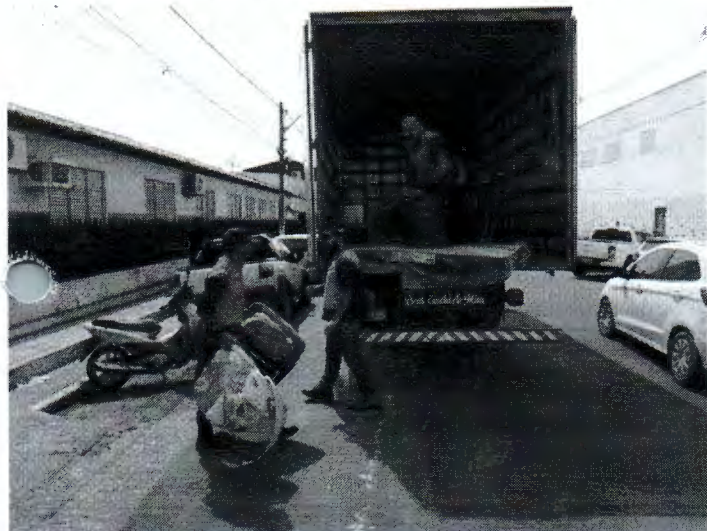
Com baixa do Rio Tocantins famílias começam a voltar para suas casas com auxílio da Defesa Civil

Após baixa do nível do Rio Tocantins, as famílias estão voltando para suas casas em segurança